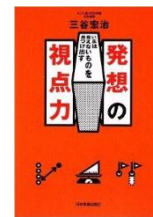
『いまは見えないものを 見つけ出す 発想の視点力』 日本実業出版社

■交通■ ・「後楽園駅」(東京メトロ丸の内線・南北線) 5番出口 徒歩1分 ・「春日駅」(都営三田線・大江戸線) 文京シビックセンター連絡口 徒歩1分 ・「水道橋駅」東口 徒歩10分