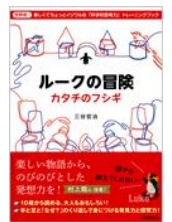
『ルークの冒険 ~カタチのフシギ~』 実務教育出版